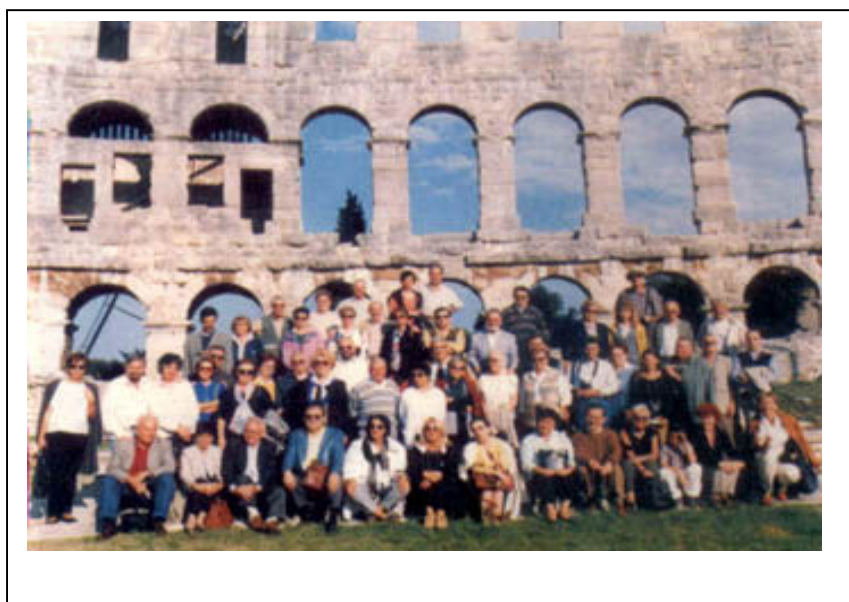
Gruppo di Soci nell'Arena di Pola nel corso di una visita guidata ai centri storici istriani.