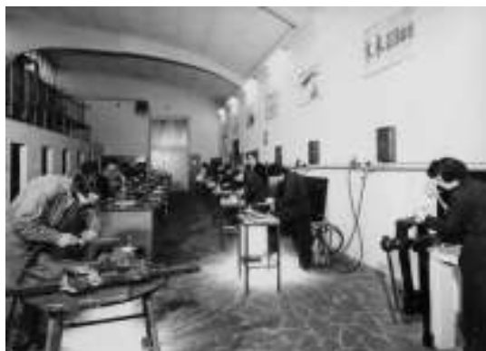
Reparto saldature (elettrica, ossiacetilenica, in arco sommerso, ecc.