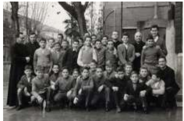
Gli allievi interni nel 1960