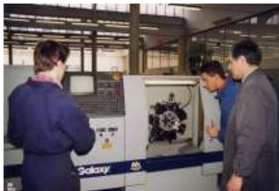
Uno dei primi torni a controllo numerico