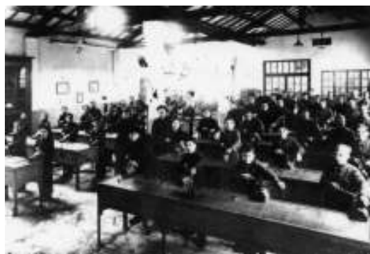
Il reparto lavorazioni al banco

Nel 1941 aggiunse anche la Scuola Tecnica Industriale, di durata biennale, legalizzata nel 1943.