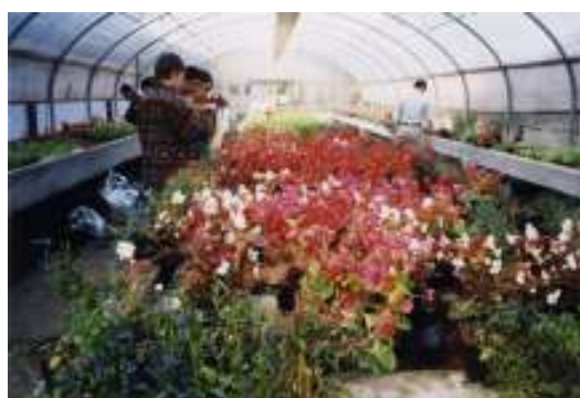
Serra-laboratorio per orto-floro-vivaisti