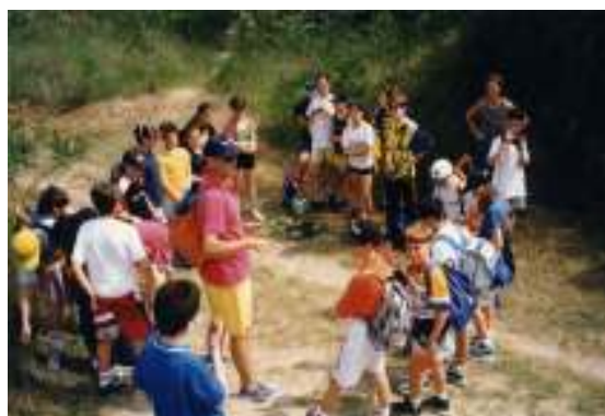
Uscita per ricerche di scienze

Nel 1981 venne iniziato un Corso Biennale di Specializzazione per Insegnanti di sostegno ad alunni handicappati, autorizzato dal Ministero della P.I. Tale Corso venne rinnovato per otto volte e si chiuse definitivamente nel 1991. Grazie alla serietà dell'insegnamento fornito da docenti di livello universitario ed alla qualità della direzione affidata al prof. Alessandro Salvini dell'Università di Padova, oltre ottocento insegnanti ottennero la richiesta specializzazione, mentre gli ispettori ministeriali si sono sempre congratulati per la qualità del servizio e la bontà della formazione fornita ai frequentanti.