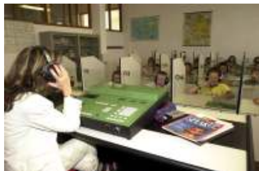
..... Laboratorio linguistico