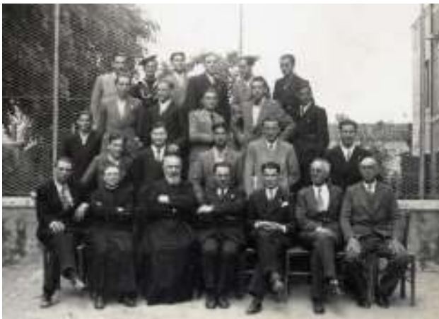
Il primo Convegno Ex Allievi nel 1935

L'Associazione invia semestralmente ai propri iscritti un notiziario intitolato "Don Orione nel Veneto – Il Berna", che riporta notizie della vita dell'Istituto e della Congregazione di Don Orione.