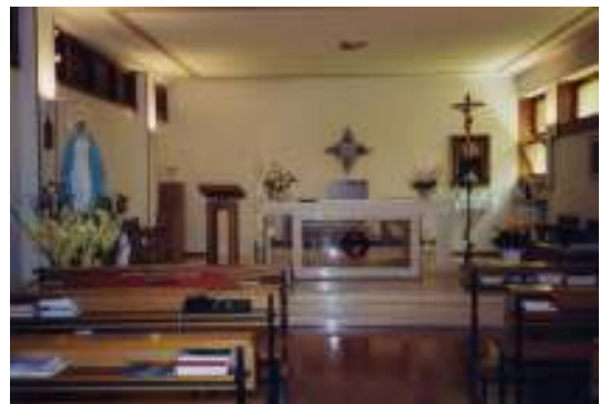
La cappella dedicata a S. Luigi Orione