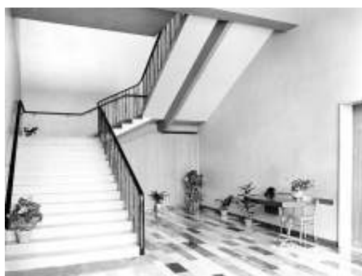
L'ingresso e le ampie scale