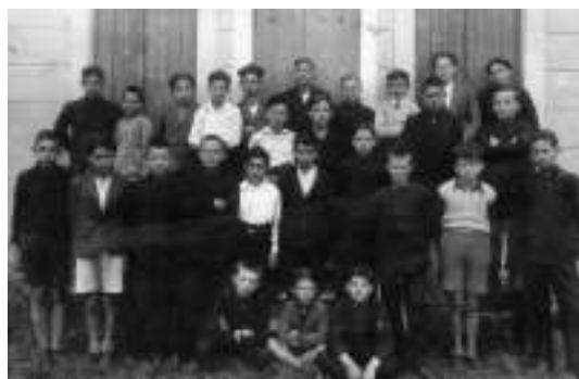
I più piccoli frequentano la scuola Elementare statale De Amicis.