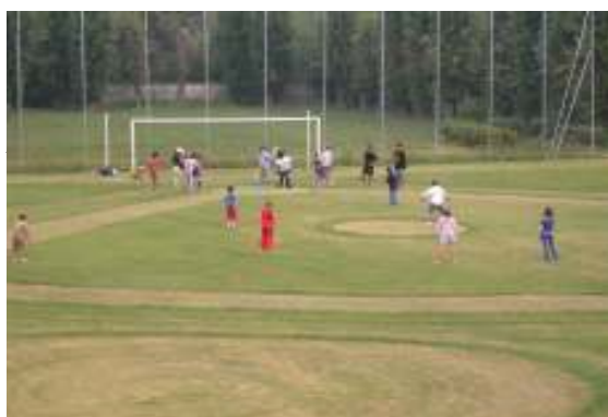
Il "diamante" del minibaseball