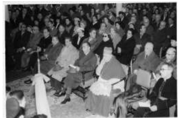
Le Autorità all'inaugurazione