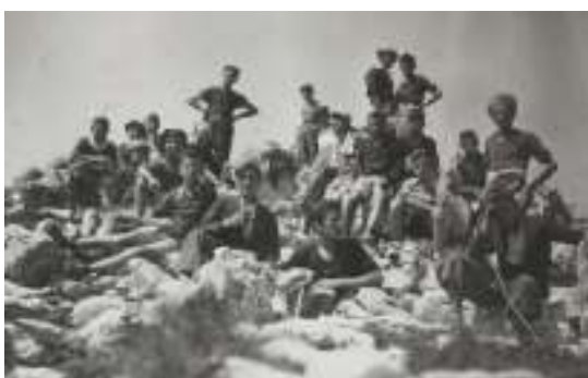
Sulla cima, finalmente!