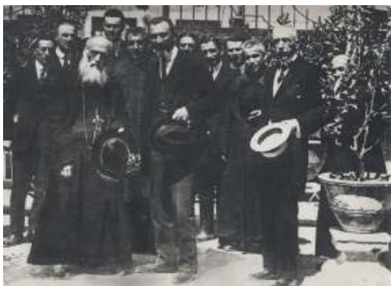
Mons. Longhin e don Luigi Orione inaugurano l’Istituto il 13 giugno 1921.

Don Orione era già molto impegnato nel Veneto per aver accettato la direzione degli Istituti Manin ed Artigianelli in Venezia, non seppe tuttavia rifiutare il suo aiuto per una iniziativa a favore di poveri figli. Quindi, dopo aver visitato la proprietà che doveva diventare sede dell’Istituto ed aver valutato le effettive necessità dell’ambiente, accettò di farsi carico dell’impresa affidandone la realizzazione al suo vicario don Carlo Sterpi, coadiuvato da tre giovani chierici della sua congregazione. Il 13 giugno 1921 l’Istituto veniva ufficialmente inaugurato con la benedizione del Vescovo di Treviso il Beato Andrea Giacinto Longhin, alla presenza di Don Orione, Don Sterpi della signorina Berna e delle autorità del luogo. L’Istituto venne posto sotto la protezione di un santo veneziano, san Gateano Thiene, educatore e formatore di giovani.