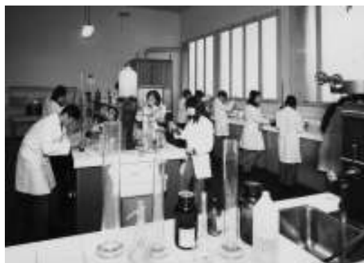
Laboratorio per analisi