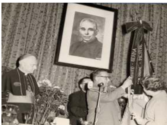
La decorazione della bandiera