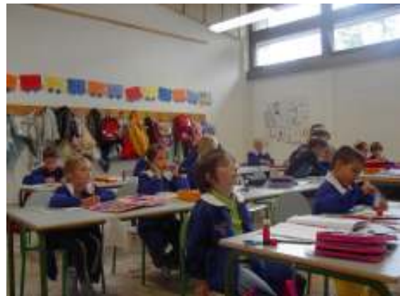
Classe II ^ elementare