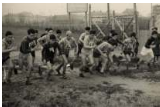
Campionati studenteschi 1939 – Il via alla corsa campestre da Corso del Popolo