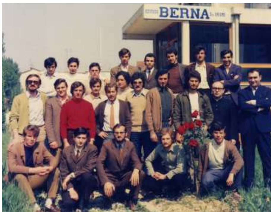
I primi diplomati dell'Istituto Tecnico Industriale (anno 1970)

Dal 1974 l'Istituto Tecnico Industriale nonostante gli ottimi risultati conseguiti e le ottime relazioni dei Presidenti degli esami di Maturità, dovette essere gradualmente chiuso per l'elevato costo di gestione, solo in minima parte coperto dalle rette versate dagli allievi frequentanti.