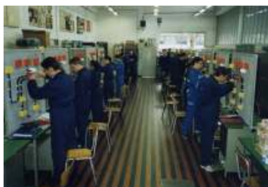
Reparto Impiantisti elettrici