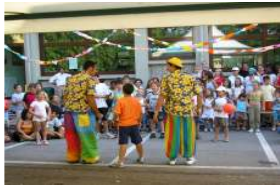
Giochi con i clown