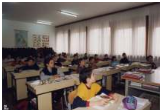
Aula I a media