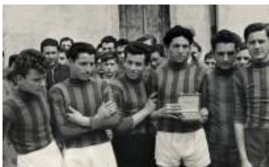
I vincitori (1°, 2° e 3°) della gara di corsa campestre