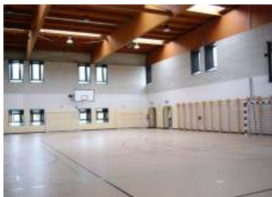
Interno della palestra