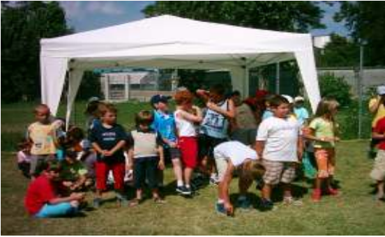
Caccia al tesoro