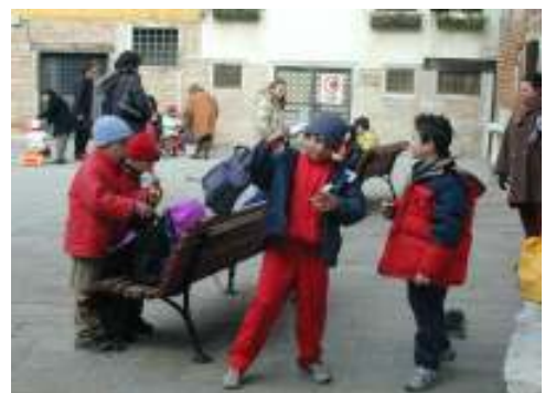
Merenda durante una gita a Venezia