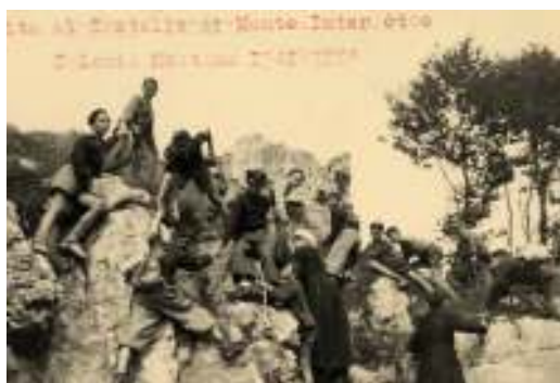
Tentativi di scalata