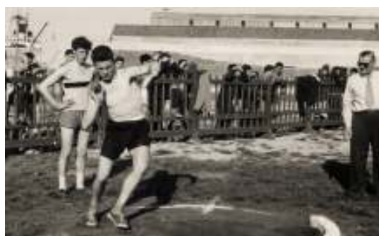
Campionati studenteschi 1939- Lancio del peso