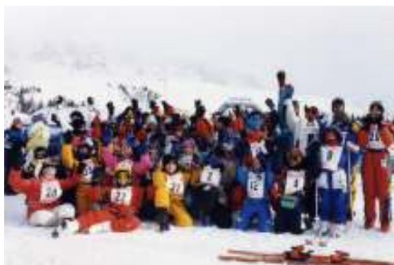
Gara finale della settimana bianca