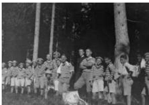
Passeggiata nei boschi dell'Altopiano