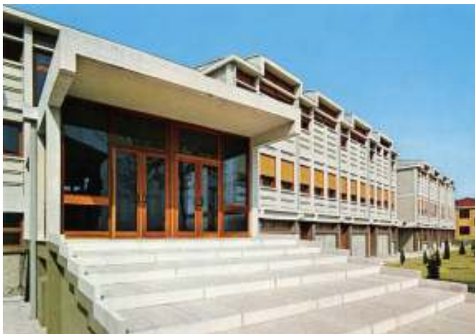
Il Card. Urbani inaugura il nuovo Convitto

Il piano regolatore di Mestre predisposto dal Comune nei primi anni '60 aveva previsto una nuova via (via Einaudi) che tagliava a metà la sede di via Manin. Fu giocoforza cedere la proprietà, anche per sopperire alle spese di costruzione del Convitto adiacente alle Scuole Berna. Il nuovo fabbricato, venne completato nel 1965. e fu inaugurato dal patriarca card. Giovanni Urbani.