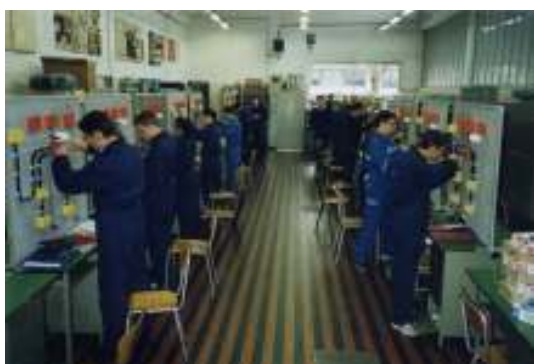
Officina impianti elettrici civili-industriali