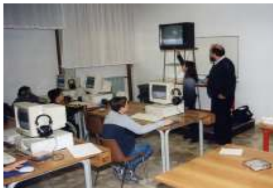
Uso dell'informatica nella didattica