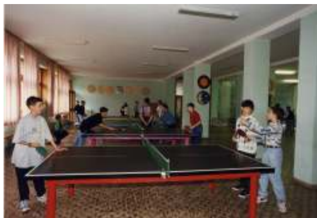
La sala giochi al coperto

Negli stessi anni la riforma scolastica prevista dalla Legge 1859 del 31/12/1062 trasformò le diverse Scuole di Avviamento in Scuole Medie unificate e le Scuole Tecniche in Istituti Professionali. Anche il Berna, conseguentemente, modificò la sua offerta formativa. Mentre la Scuola Media non richiese forti investimenti e quindi non ebbe particolari problemi, la Scuola Tecnica, trasformata in Istituto Tecnico Industriale per Metalmeccanici, obbligò La Provincia Religiosa ad effettuare forti investimenti per l'istituzione o il potenziamento con adeguate attrezzature di laboratori dedicati alla qualifica del titolo (metalmeccanica). Venne predisposto un reparto per la fusione dei metalli e delle leghe; venne potenziato il reparto macchine utensili con macchine ad elettroerosione per la lavorazione delle parti dei congegni ottenuti con le fusioni. In particolare, oltre ai laboratori tecnici per le prove distruttive e non distruttive dei metalli, venne predisposta una struttura adeguatamente protetta per effettuare radiografie delle fusioni e delle saldature effettuate durante le esercitazioni, allora unico laboratorio in Venezia e nelle vicine province.