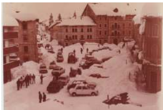
Sul fondo, la Colonia donata al Berna