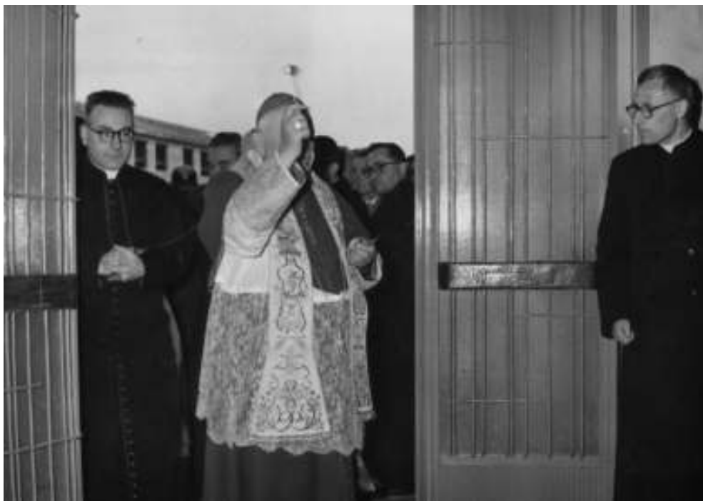
Il Patriarca benedice la nuova struttura