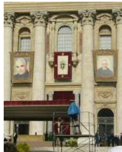
Canonizzazione di San Luigi Orione