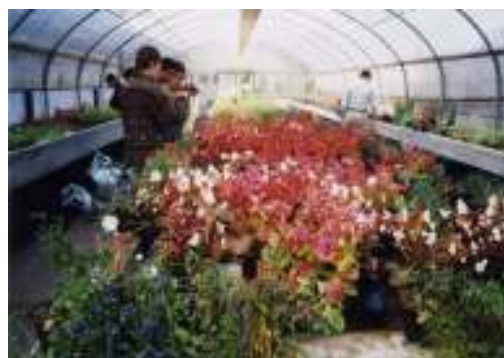
Corso floricoltori: la serra in fiore