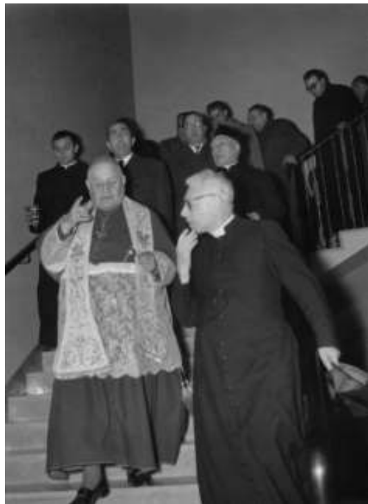
Il Card. Angelo Roncalli visita l'edificio scolastico