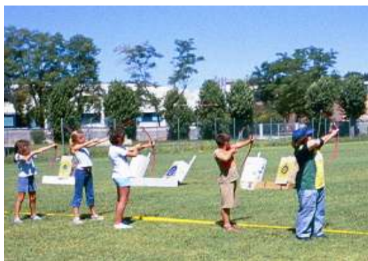
Tiro con l'arco