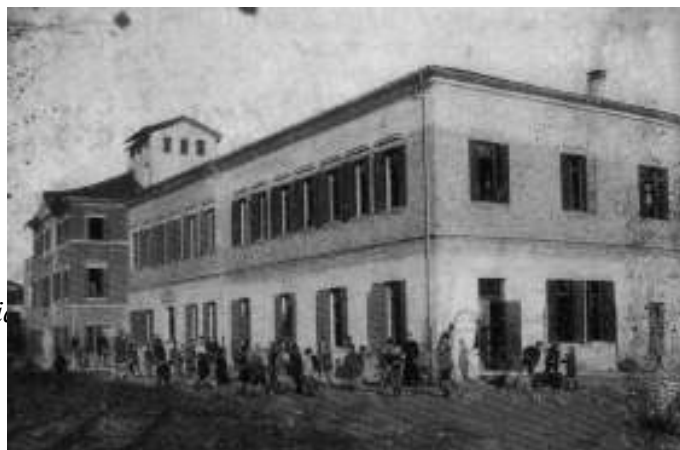
L'Istituto Berna ai suoi inizi, visto da via Manin.