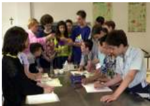
Lezione di scienze