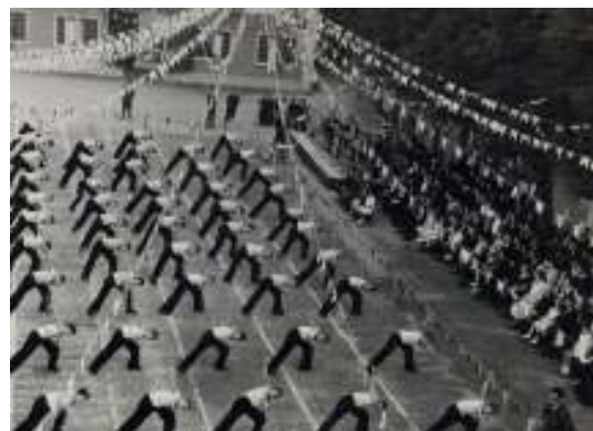
Saggio di fine anno nel cortile di via Manin

Intanto la crescita del numero degli allievi, soprattutto esterni, aveva reso insufficienti gli ambienti ricavati nella sede di via Manin. Trascorsero però una decina d'anni prima che nel 1956, superate le difficoltà del dopoguerra, si desse inizio alla costruzione in via Bissuola di un fabbricato scolastico dotato di vasti laboratori e numerose aule. Il 15 marzo del 1958 l'edificio venne inaugurato dal card. Angelo Roncalli, allora patriarca di Venezia. L'internato rimase in via Manin, le scuole e i corsi si trasferirono nel nuovo edificio.