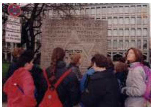
Gita scolastica in Germania