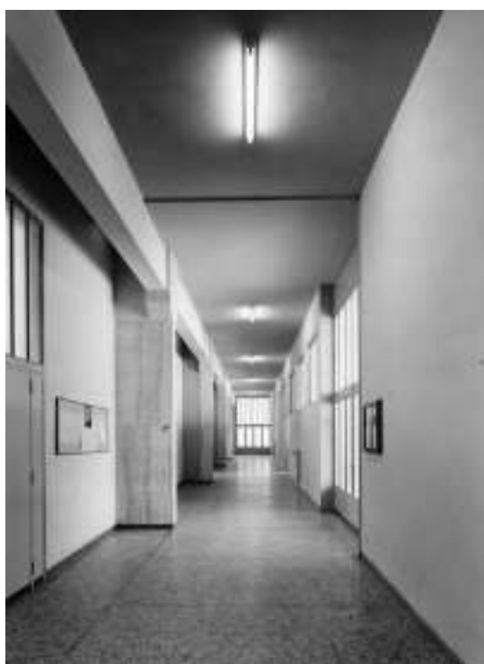
Il corridoio degli uffici