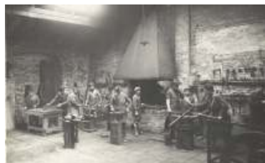
Ragazzi in una officina fabbrile esterna