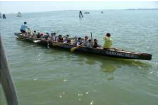
Voga in laguna