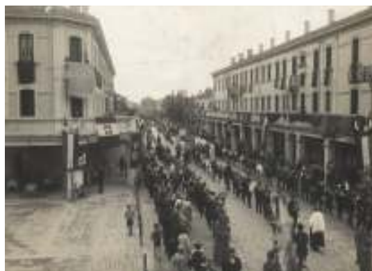
La banda ad una processione in via Piave