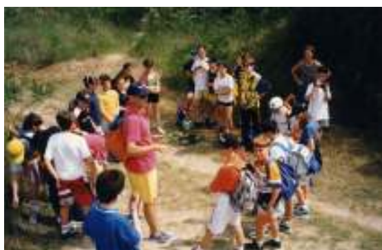
Lezione di scienze all'aperto

Durante l'anno vengono svolte attività diverse quali corsi per apprendere a suonare vari strumenti musicali, per informatica o altro, a richiesta. Vengono anche attivate uscite da scuola a scopo ricerca e scoperta, particolarmente preparate e seguite da attività di interiorizzazione e di riflessione. Viene anche proposta la partecipazione, durante l'inverno alla "settimana bianca", un periodo di vita in ambiente montano per favorire la socializzazione degli alunni in ambiente extrafamiliare e per avviare i ragazzi alla scoperta delle bellezze della natura.