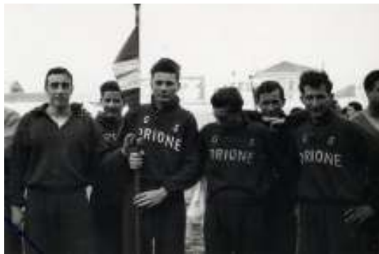
Il Gruppo sportivo Orione, sempre tra i primi