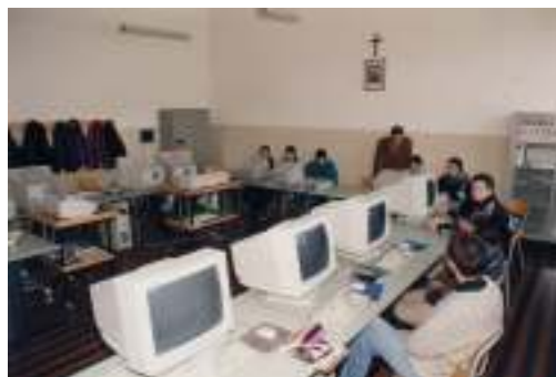
Aula per informatica

Nel 1976 essendo venuta meno la necessità di accoglienza di ragazzi orfani o privi di famiglia, il Convitto cessò la sua funzione. Con opportune modifiche, una parte dell'edificio venne modificata trasformando gli ambienti in aule e laboratori per la Scuola Media. Un ulteriore spazio venne attrezzato per ospitare un piccolo Pensionato Studentesco, altri ambienti vennero destinati ad attività varie (convegni, incontri, corsi gestiti da esterni, ecc.).