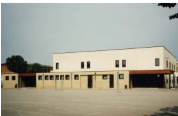
La nuova palestra: esterno

pallavolo... Tutte queste strutture sono a disposizione degli alunni frequentanti ed anche di gruppi sportivi esterni.