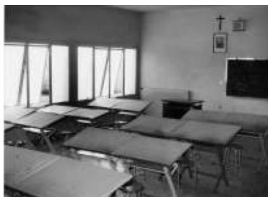
Una delle 14 aule a disposizione