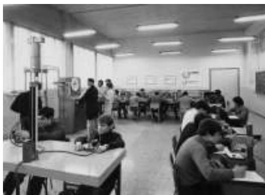
Laboratorio tecnologico prove distruttive

Negli stessi anni la riforma scolastica prevista dalla Legge 1859 del 31/12/1062 trasformò le diverse Scuole di Avviamento in Scuole Medie unificate e le Scuole Tecniche in Istituti Professionali. Anche il Berna, conseguentemente, modificò la sua offerta formativa. Mentre la Scuola Media non richiese forti investimenti e quindi non ebbe particolari problemi, la Scuola Tecnica, trasformata in Istituto Tecnico Industriale per Metalmeccanici, obbligò La Provincia Religiosa ad effettuare forti investimenti per l'istituzione o il potenziamento con adeguate attrezzature di laboratori dedicati alla qualifica del titolo (metalmeccanica). Venne predisposto un reparto per la fusione dei metalli e delle leghe; venne potenziato il reparto macchine utensili con macchine ad elettroerosione per la lavorazione delle parti dei congegni ottenuti con le fusioni. In particolare, oltre ai laboratori tecnici per le prove distruttive e non distruttive dei metalli, venne predisposta una struttura adeguatamente protetta per effettuare radiografie delle fusioni e delle saldature effettuate durante le esercitazioni, allora unico laboratorio in Venezia e nelle vicine province.