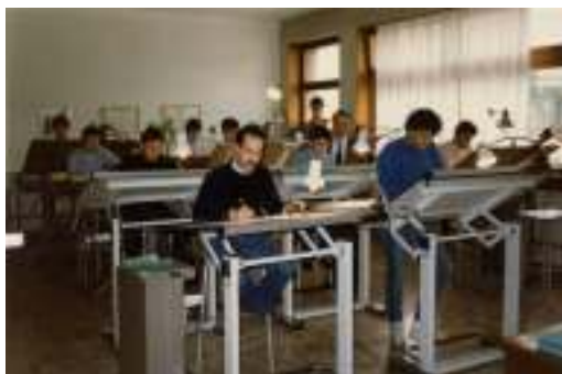
Aula per disegno tecnico