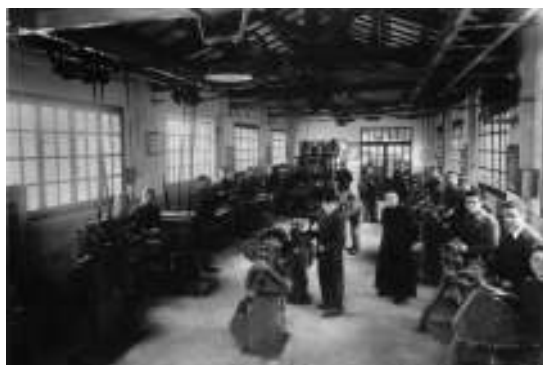
Il reparto macchine utensili nel 1945