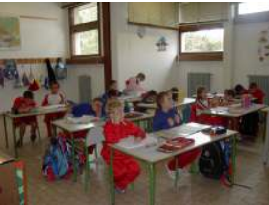
Classe I ^ elementare

La Scuola primaria - I° ciclo è stata avviata nell'anno 2001 e quindi consiste, per ora, di quattro classi; due prime, una seconda ed una terza. Le insegnanti sono ben preparate, ricche di entusiasmo e di iniziativa