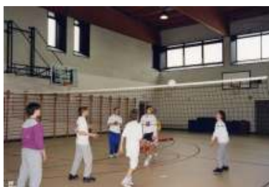
Partita di volley