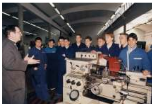
Lezione di inizio corso

Nell'ottobre del 2001 la gestione del Centro Professionale, per motivi di carattere organizzativo, venne affidata dalla Provincia Religiosa ad una Associazione denominata "ENDO-FAP MESTRE ISTITUTO BERNA", costituita tra gli insegnanti del Centro stesso.