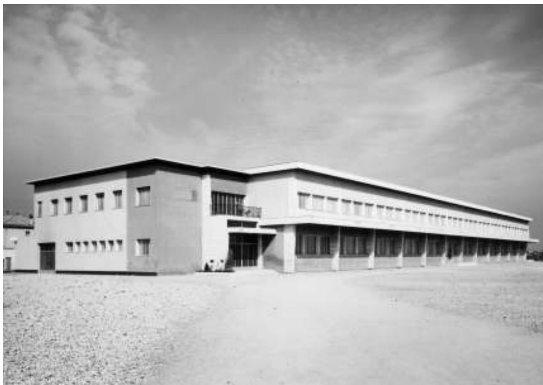
Il nuovo edificio delle scuole di Avviamento Professionale a tipo Industriale e Scuola Tecnica Industriale (oggi Centro di Formazione Professionale)