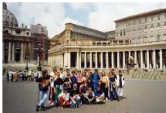
Gita a Roma