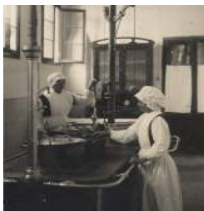
Suore in cucina preparano i pasti