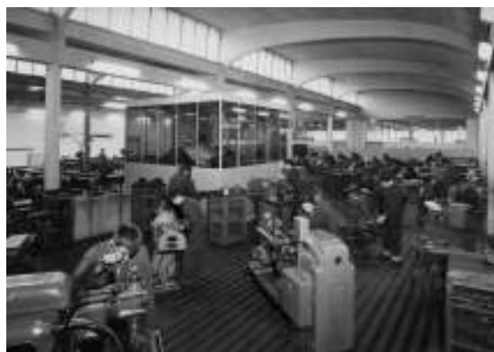
Officina macchine utensili