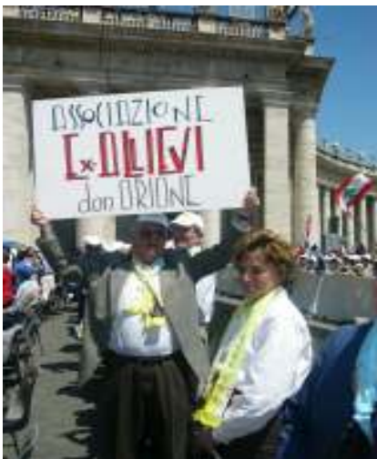
Ex Allievi in festa