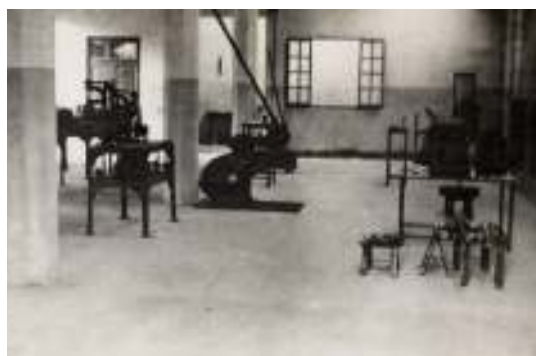
Le prime macchine donate da benefattori