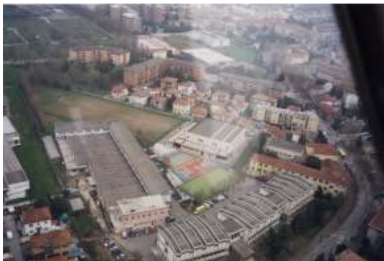
Vista dall'alto del complesso dei tre edifici che oggi compongono l'Istituto.