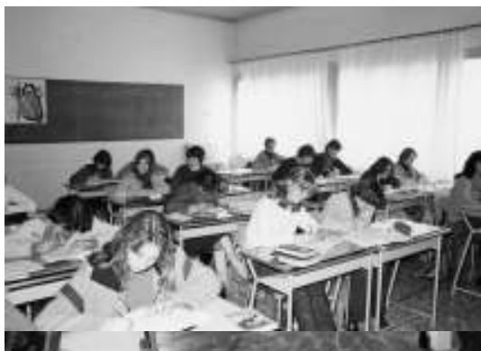
Aula per lezioni teoriche