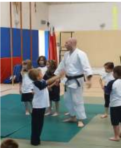
Corso di judo