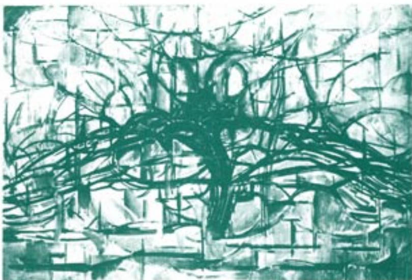
Piet Mondrian: Albero, c. 1911, New York, S. Jaria Gallery